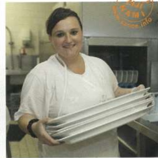
Hilton Prague Old Town

anotace autorizované umělci, foto umělců a grafická úprava – Projekt Šance foto uměleckých děl © Ondřej Kocourek, není-li uvedeno jinak